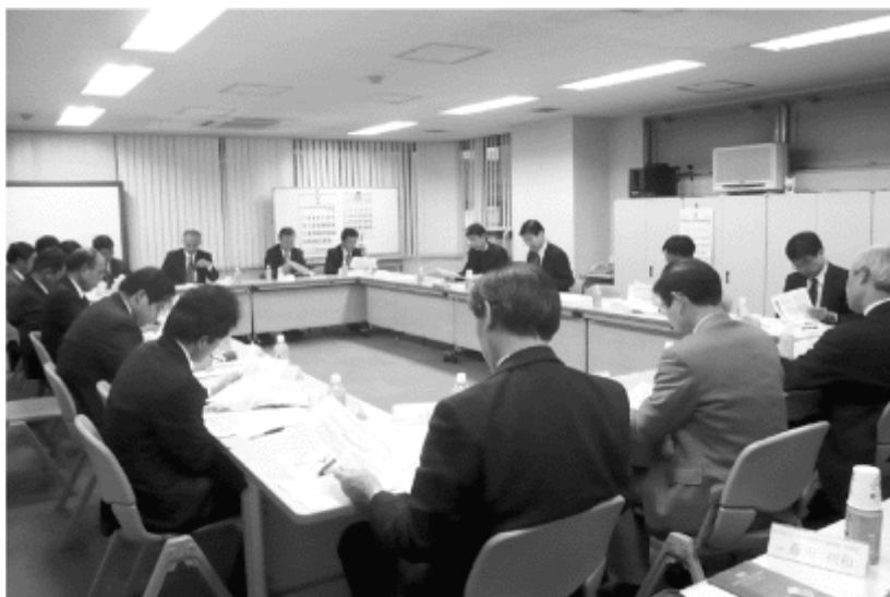
意見交換会の風景

民間事業者研究会からは、かねてから取り組んでいる既成市街地における研究成果に基づく提案を行い、その後、活発な自由意見交換が行われました。