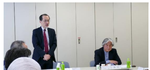
↑ 国土交通省渡邊市街地整備課長と野口評議員会議長